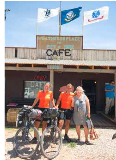
Pauze in Pie Town, New Mexico

Die dikke auto kan geen doel zijn in mijn leven